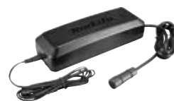
Karikues DC4001 191L00-4*